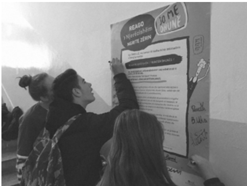
Rad na kampanji: Intervencija „Reagiraj kao ljudsko biće“ promovira građansku hrabrost među mladima

Kada su me maltretirali u školi, umjesto da dovedem muškarca da me zaštiti – kao što to zahtijeva tradicija – ja sam doveo svoje sestre. Moje sestre su tokom mog odrastanja bile moje najbolje prijateljice i uzori. Danas imam tri nećake i nećaka, a oni me inspiriraju da radim na promociji rodne jednakosti. Danas s velikom radošću i zadovoljstvom radim s mladićima i odnedavno s očevima i budućim očevima. To je lako za mene jer vjerujem u rodnu jednakost, to je sastavni dio mog života. Znam koliko je važno da se prema osobi odnose na jednak način, to je osnovno ljudsko pravo.