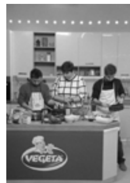
Promocija kluba „Budi muškarac“ tokom emisije o kuhanju „Dička po zihet“ na nacionalnoj televiziji 21. Na

Promocija rodne jednakosti s pristupom mladićima bila je nešto novo za društvo na Kosovu. Svjedoci smo činjenice da je postojala potreba za projektom poput ovog, jer je nedostajao jako dugo. Nije bilo nimalo lako približiti se mladićima, sjesti s njima i razgovarati o rodu, rodno zasnovanom nasilju i njihovom zdravlju i dobrostanju. Što je projekat duže trajao, to su oni bili revnosniji. Kada se bavi ovim pitanjima, jednostavna reakcija je